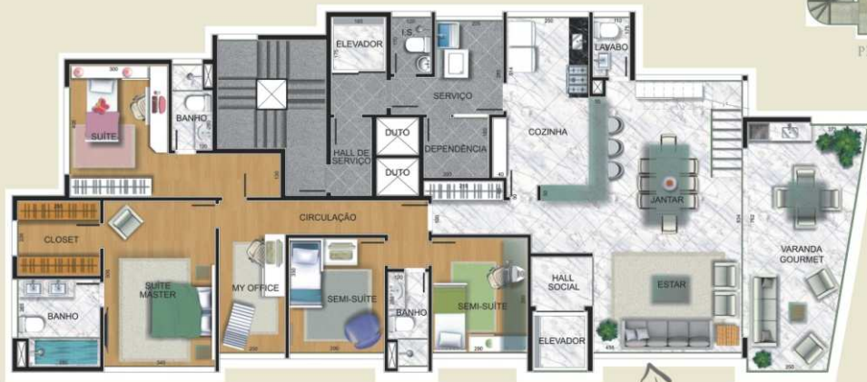
PLANTA PRIMEIRO ANDAR