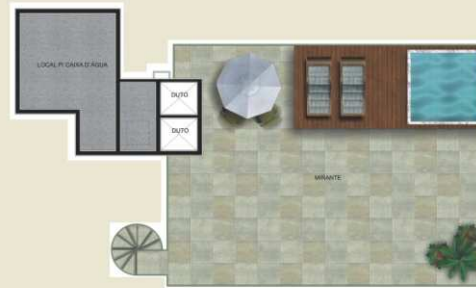
PLANTA TERCEIRO ANDAR