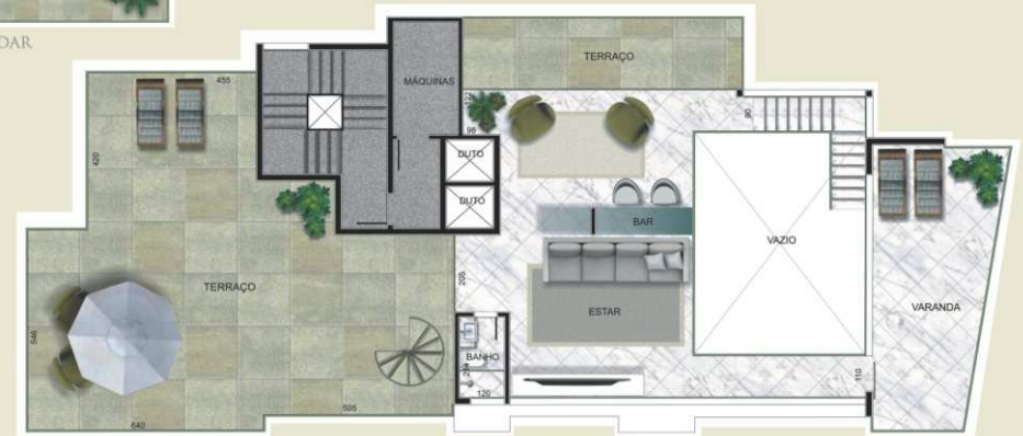
PLANTA SEGUNDO ANDAR