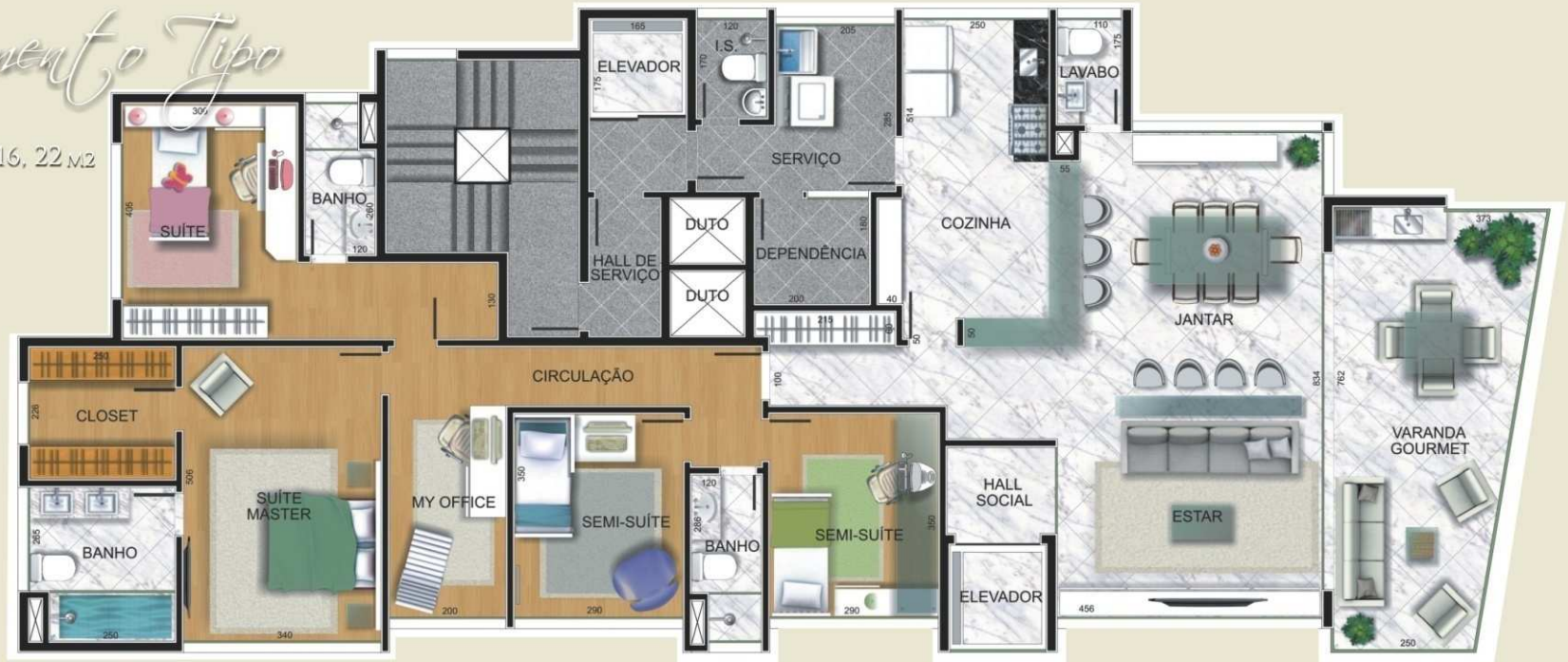
PLANTA PAVIMENTO TIPO