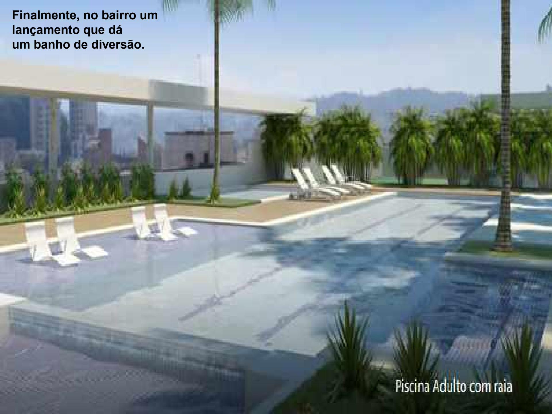
Piscina Adulto com raia

Finalmente, no bairro um lançamento que dá um banho de diversão.